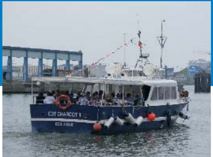
Le Charcot II - Ch Lemesle