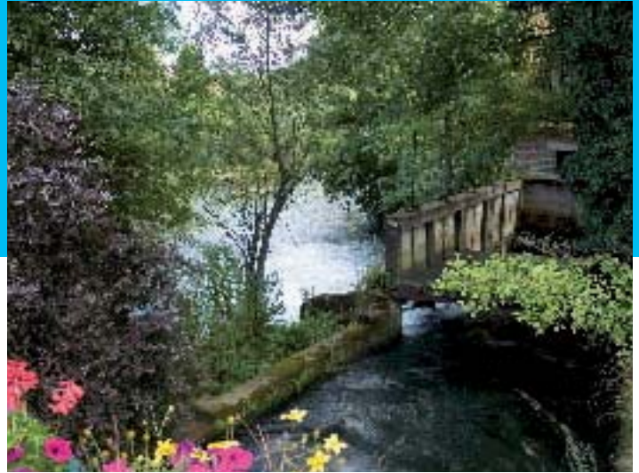
Vallée de la Course - JL Bailleul