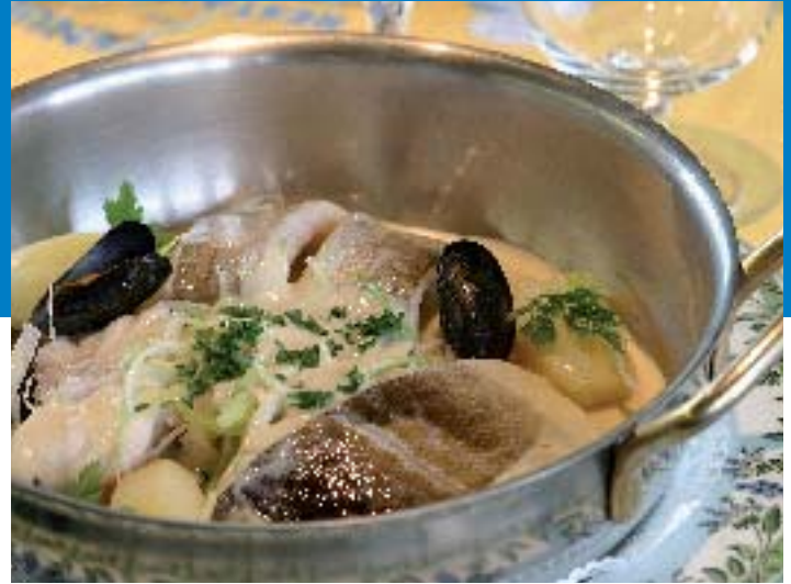
Gastronomie de la mer - E Desauois