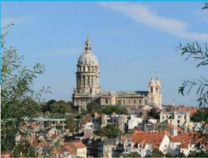
Boulogne - AS Flament