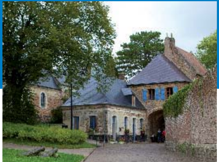
Montreuil - E Desauvois