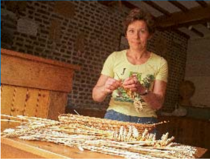
Tressage de Blé - P Morès