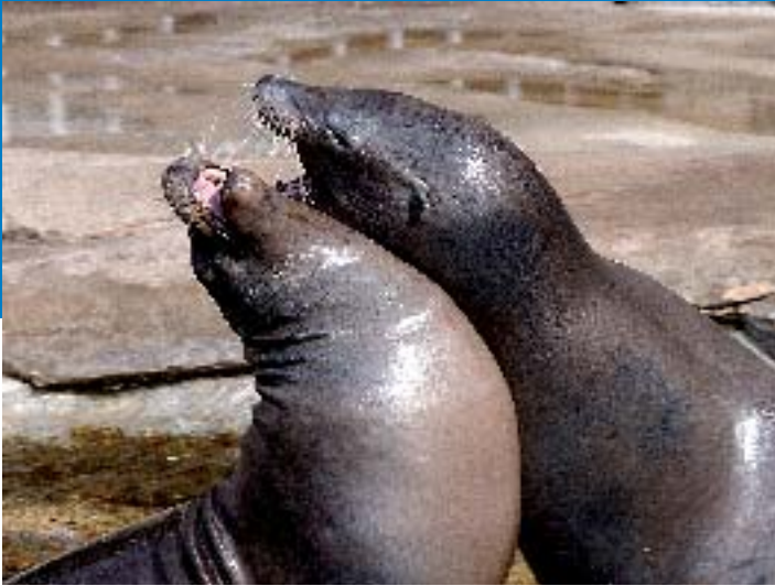
Nausicaa - S Jarry CG62