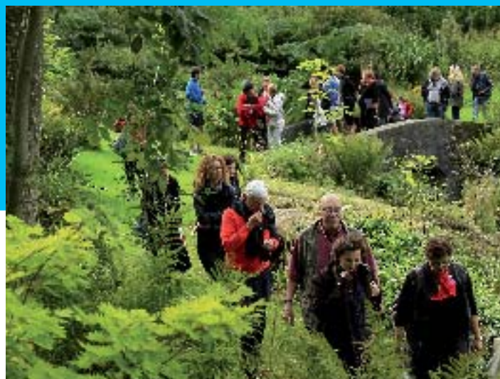
Jardin de Conteval - AS Flament