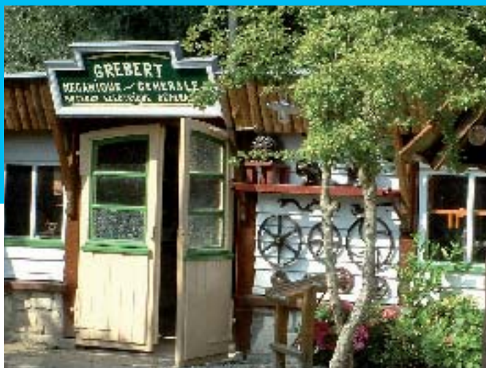
St Joseph Village