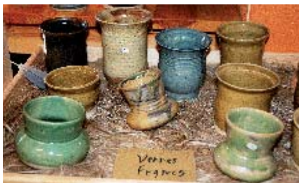
Poterie La Tour de Grés