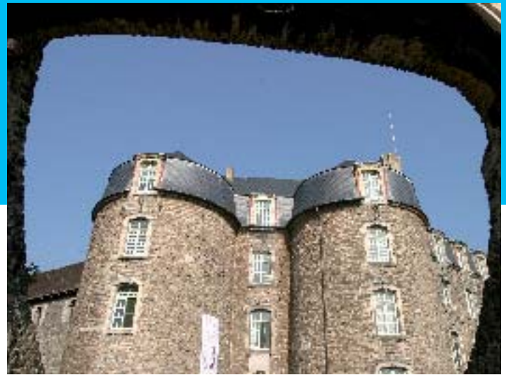
Château-Musée - E Desauois