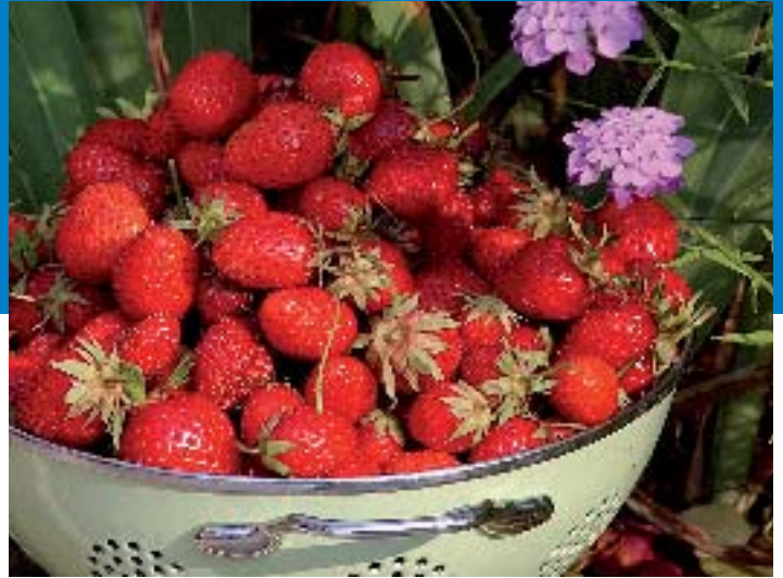
Fraises de Samer - S Jarry CG62