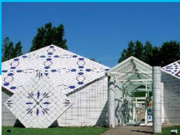
Maison de la Faïence