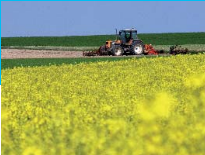
Colza - S Jarry CG62