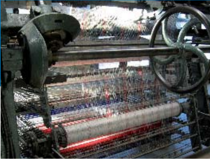
Cité de la dentelle