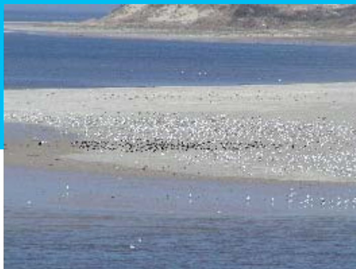
Baie de Canche