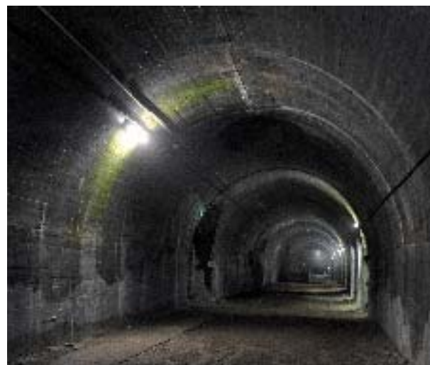
Mimoyecques - P Morès

Forteresse de Mimoyecques - LANDRETHUN LE NORD Tél 03.21.87.10.34 mimoyecques@lacoupole.com www.mimoyecques.com