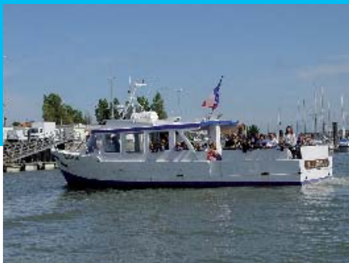
Croisière Baie de Canche