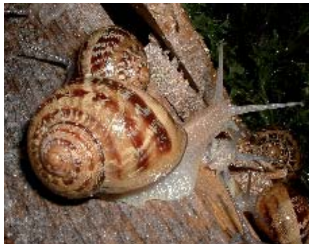
escargotière du Choquel