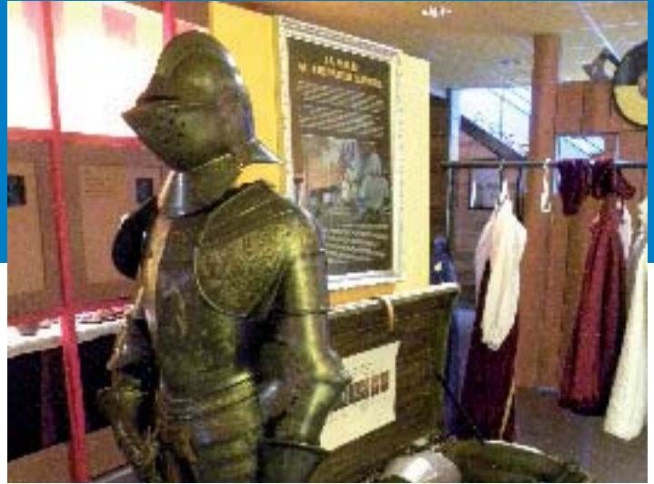
Tour de l'Horloge