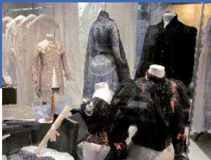
Cité de la dentelle

d'eau douce et terrestres (requins, lions de mer, manchots, poissons tropicaux ou des grands fonds, crustacés...). Le Centre National de la Mer offre une visite spectaculaire, tout en sensibilisant le visiteur à une meilleure gestion des océans.