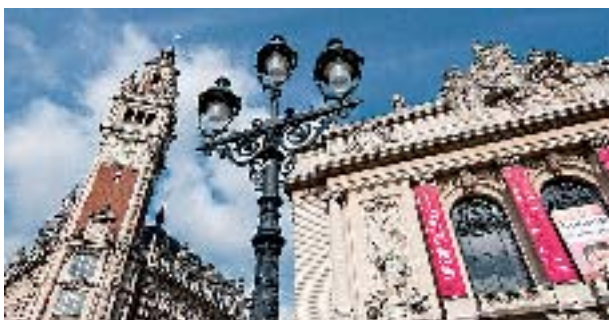
Opéra de Lille - R Vimont