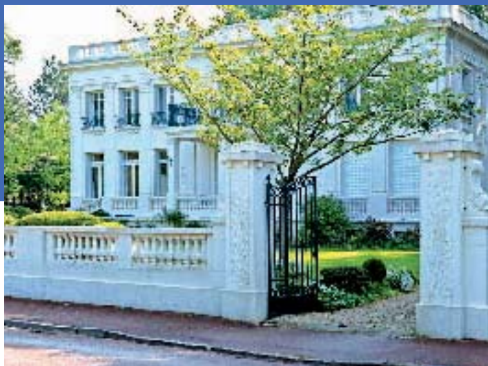
Villa du Touquet - JL Bailleul

grands bassins, 1000 espèces, 35000 animaux marins, d'eau douce et terrestres (requins, lions de mer, manchots, poissons tropicaux ou des grands fonds, crustacés...).