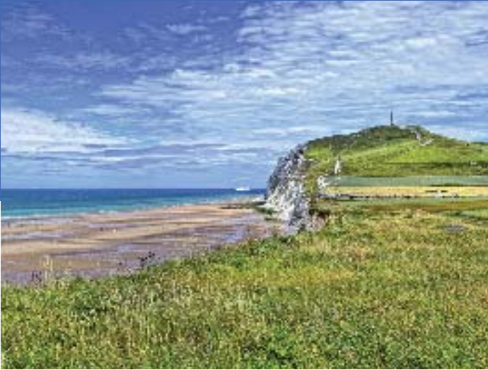
Cap Blanc Nez - E Desauois