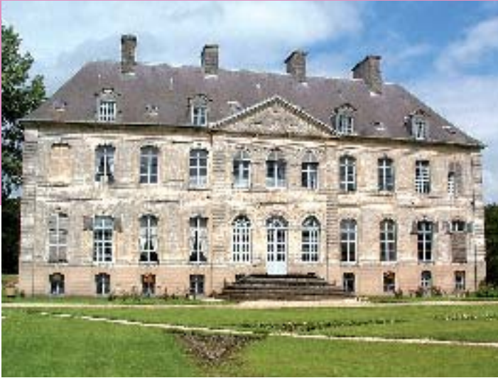
Château de Couin