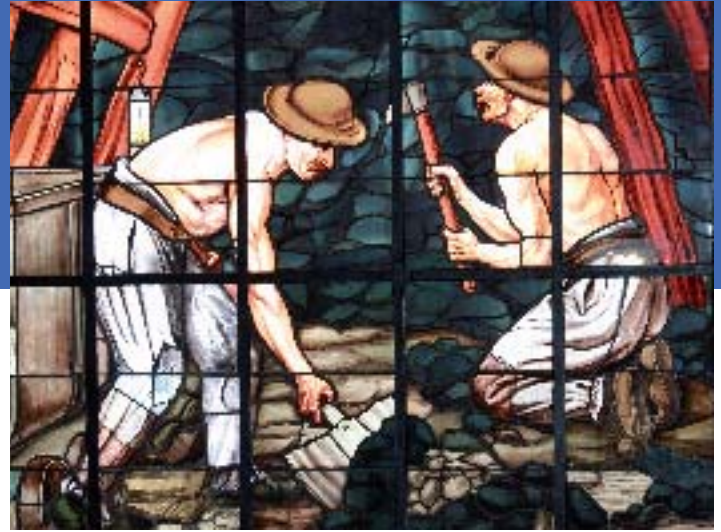
Vitrail Hôtel de Ville de Bruay