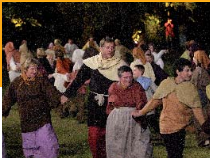
Légende des Princes irlandais