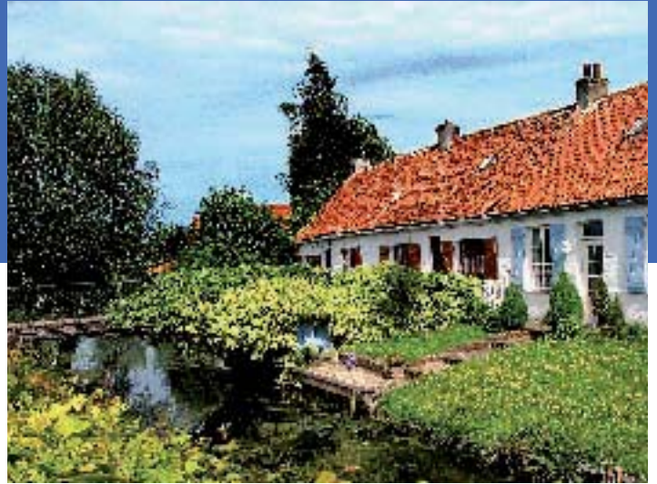
St Omer - S Jarry CG 62