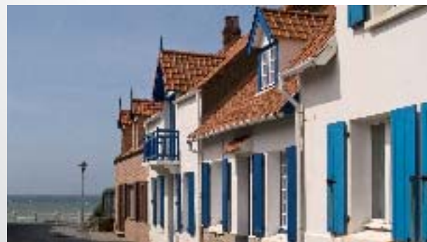
Maisons pêcheurs - JL Bailleul