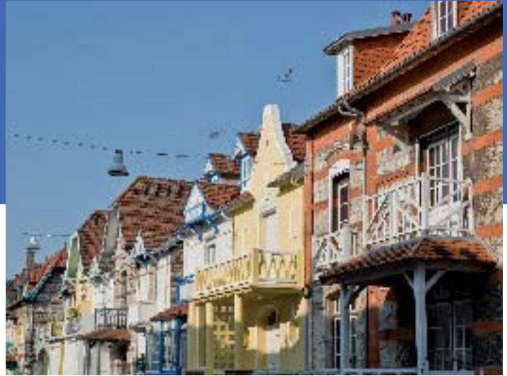
Le Touquet - JL Bailleur