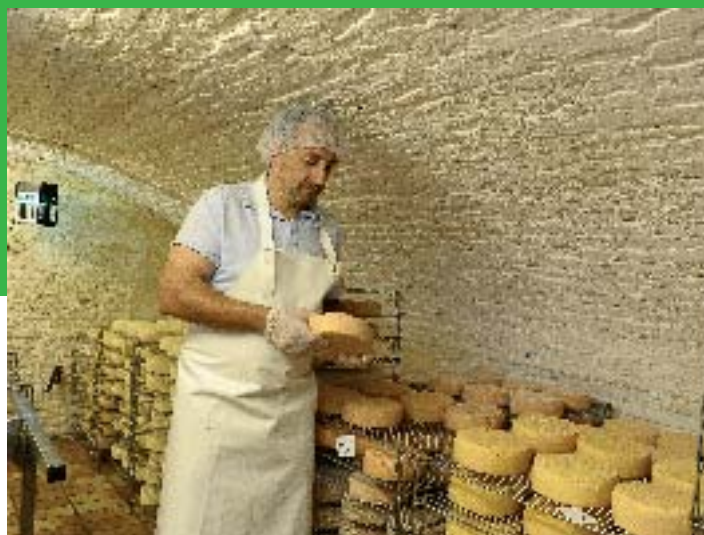
Sire de Créquy - P Morès