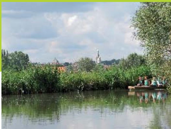
Balade marais - Di