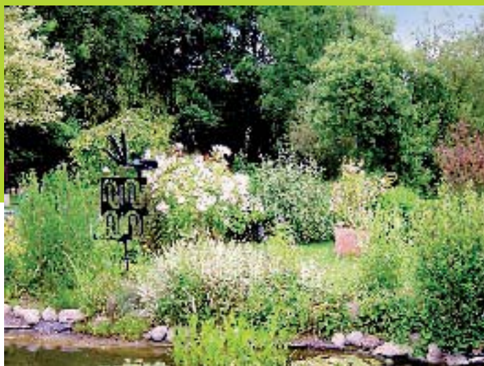
Sculptures et Jardin