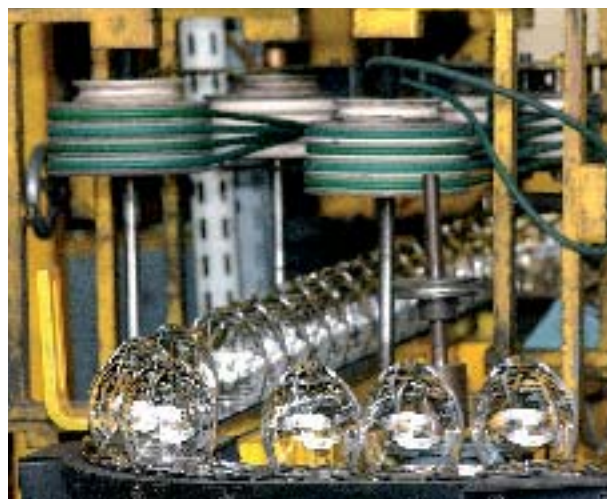
Arc International - S Jarry CG 62

Déjeuner dans un restaurant du Pays de St-Omer