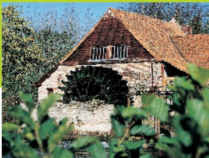
Moulin de Maintenay