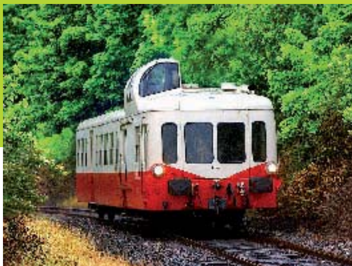
Train AA - S Jarry CG62