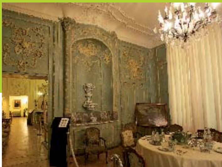
Musée Sandelin - E Desaunois