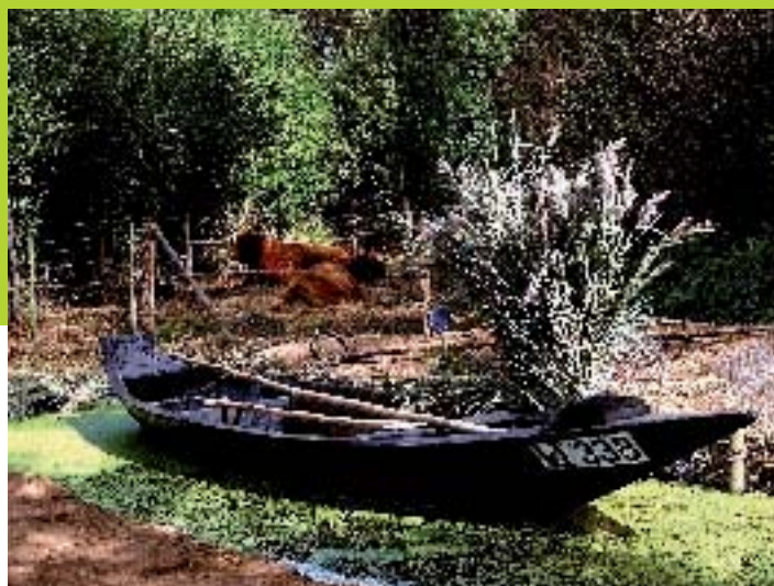
Bacove - S Jarry CG62