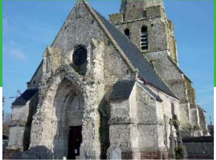
Eglise de Mazinghem