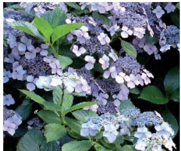
Parcs & Jardins

Circuit guidé dans votre car, durée 2 heures