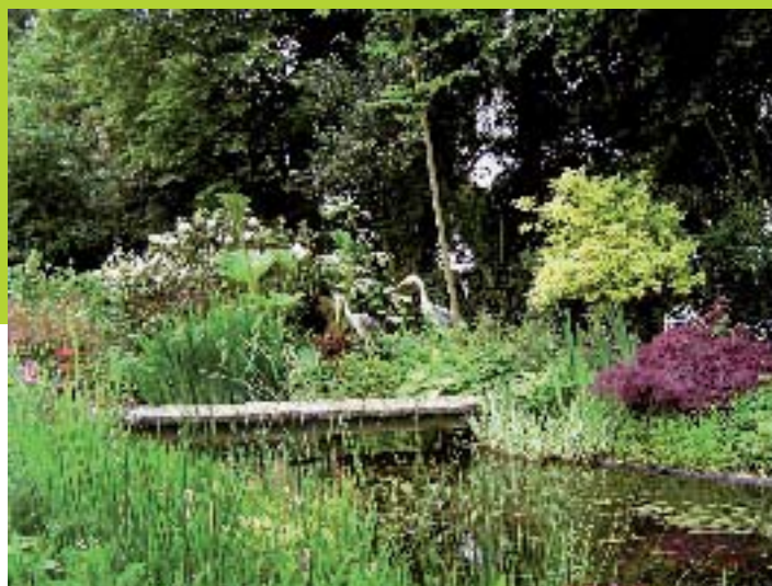
Le Jardin des Lianes