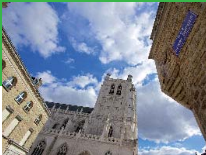
St Omer - E Desauois