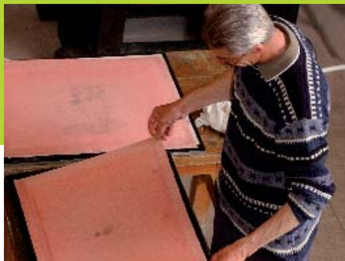
Maison du papier - S Jarry CG62