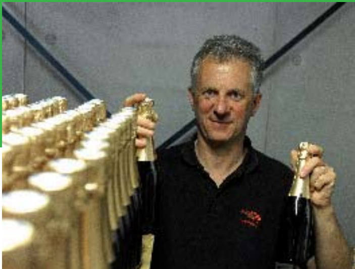
Perlé de Groseille - P Morès