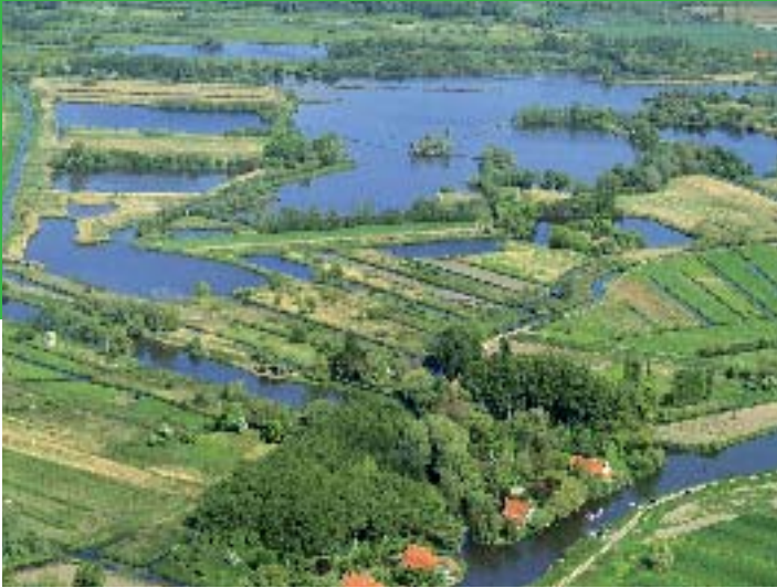
Le Marais Audomarois