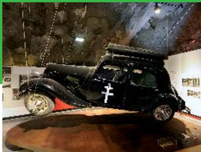
La Coupole - S Jarry CG 62