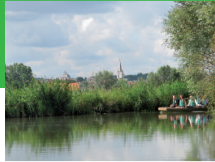
Balade marais - Di