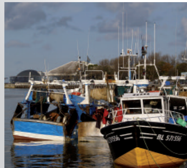
Port de Boulogne et Nausicaa

Comprenant : les visites prévues au programme, le déjeuner (boissons comprises).