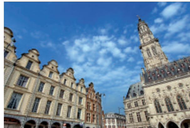
Arras - S Jarry CG62

Pas de Calais TOURISME pas-de-calais.com