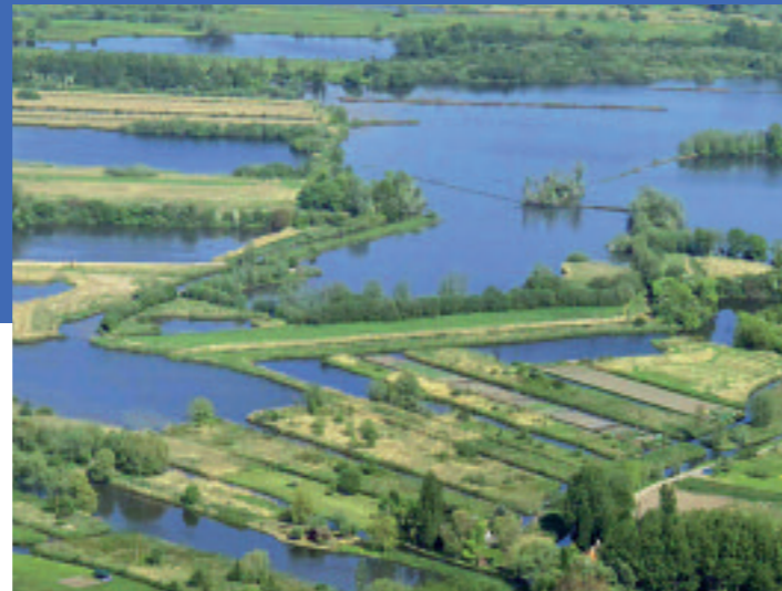
Le Marais Audomarois

Impression : L'Artésienne - LIEVIN - Tél. : 03.21.72.78.90 / Imprimerie éco responsable