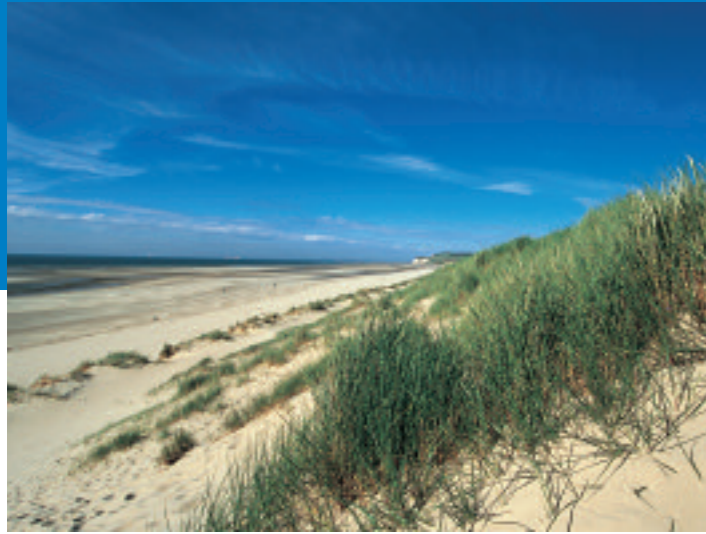
Site des Caps - E Desauois