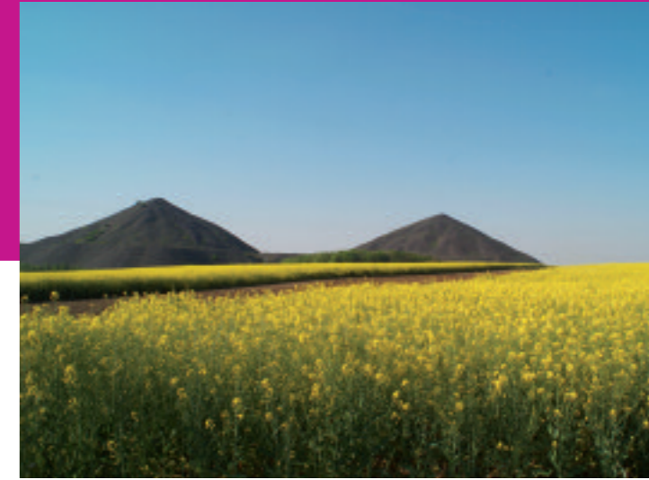
Terrils - P Morès