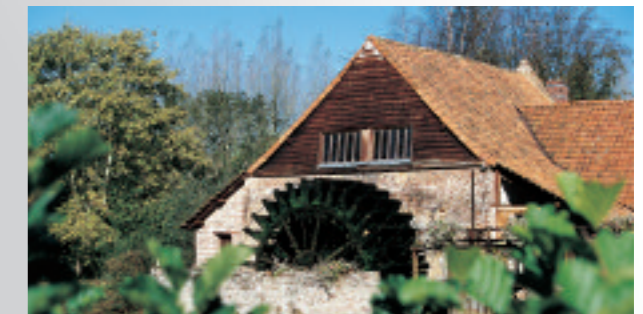
Moulin de Maintenay

Comprenant : les visites prévues au programme et le déjeuner (boissons comprises).